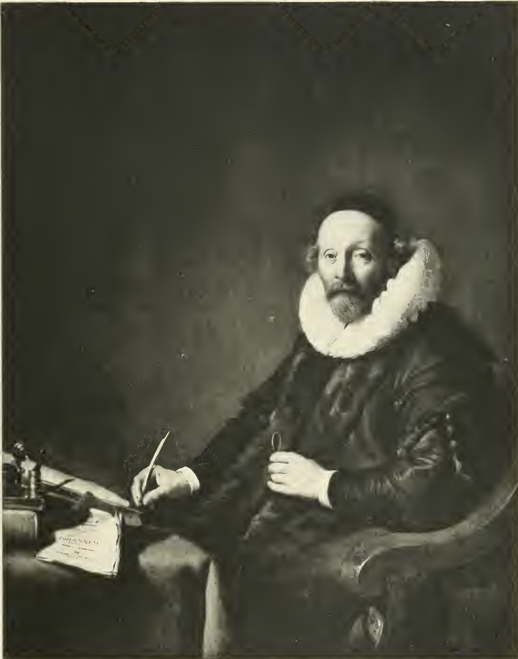
L'EGLISE REMONTRANTE à AMSTERDAM